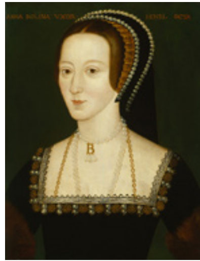
Faren og moren til Elizabeth, Henrik 8. og Anna Boleyn.